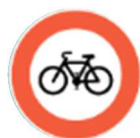
Accès interdit aux cycles