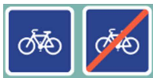
Piste ou bande conseillée et réservée aux cycles