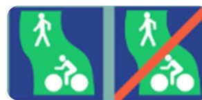
Voie verte réservée aux piétons, aux cavaliers et aux véhicules non motorisés.