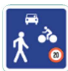
Zone de rencontre : priorité aux piétons ; double sens cyclable.