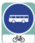
Voie réservée aux transports en commun et autorisée et aux cycles